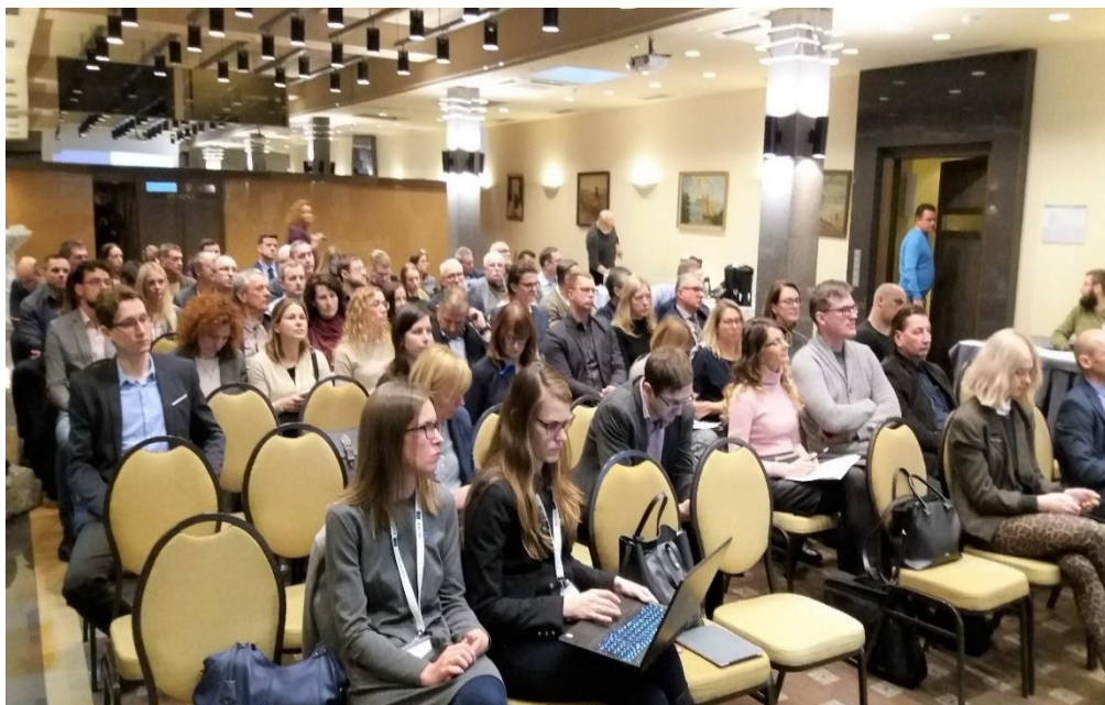
KVIEČIAME SUSIPAŽINTI SU LIFE PROGRAMOS NAUJOVĖMIS, PROJEKTO RENGINIAIS, PASIEKIMAIS